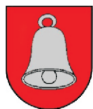
City Spišská Belá