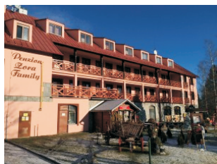
Penzión ZORA Tatranská Lomnica